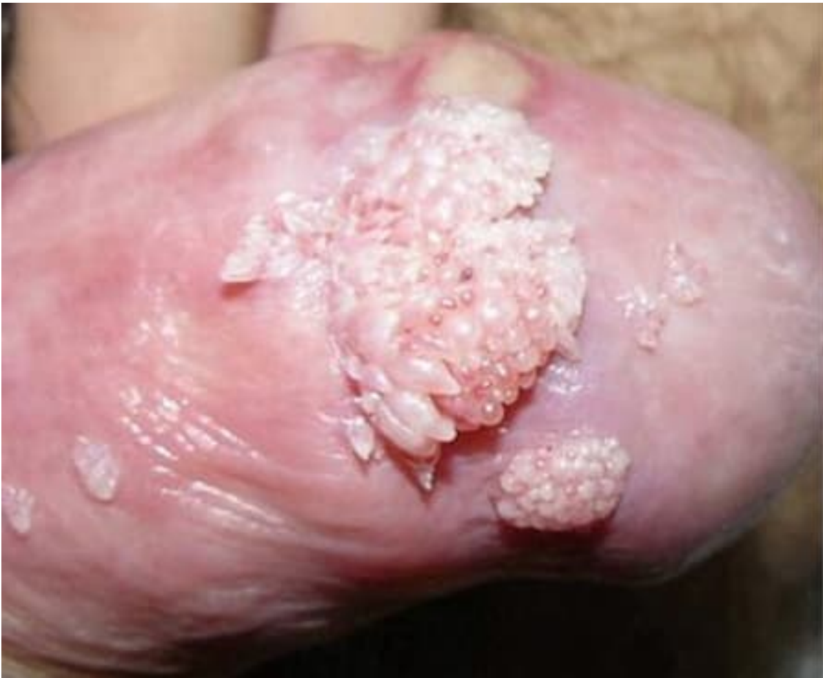
Hình ảnh bệnh sùi mào gà ở rãnh lớp da bọc dương vật